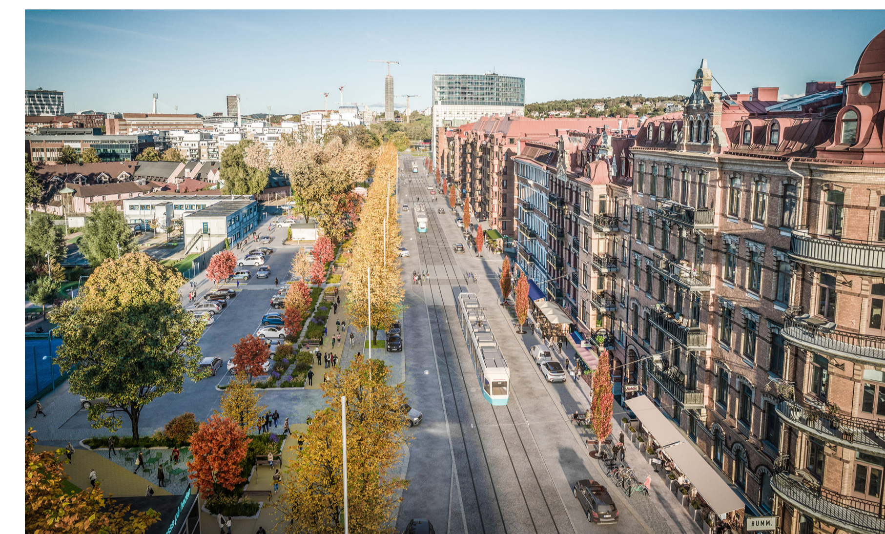
Föreslagen utformningen av Engelbrektsgatan med en ny spårväg mitt i gatan med bilkörfält på ömse sidor, bättre kopplingar, gångstråk och en ny cykelväg längs med gatans norra sida (AL Studio/02landskap).